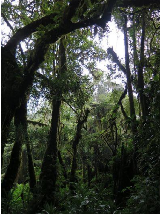
Les Chingawa