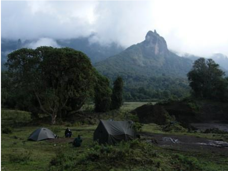
Během terénních expedic vědci často přespávají ve stanech. V pozadí se tyčí Harenský les.