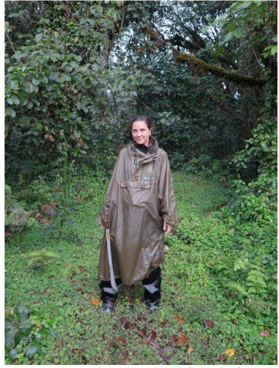
Les Chingawa je místy natolik hustý, že je nutné si cestu prosekávat mačetou.