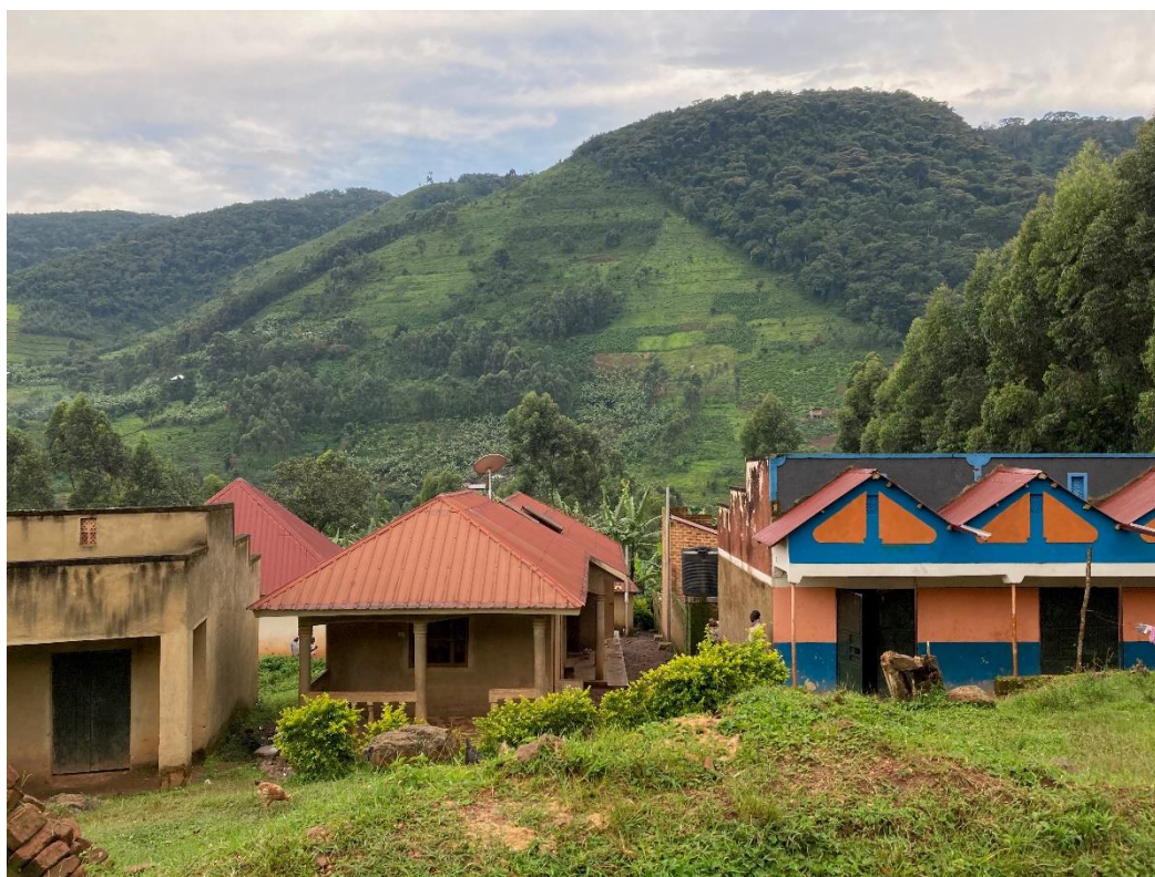
Výzkum probíhal v ugandském národním parku Bwindi Impenetrable National Park. V pozadí je patrná odlesněná část původního pralesa, která ilustruje dlouhodobý tlak člověka na habitat goril horských.