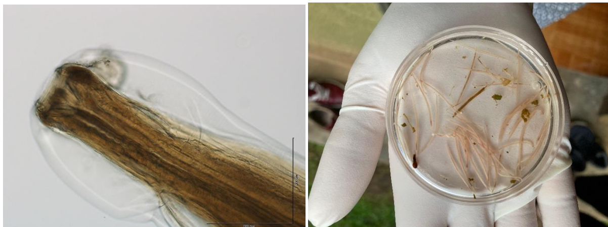
Hlístice rodu Oesophagostomum pravděpodobně způsobují chronické chřadnutí u horských goril.